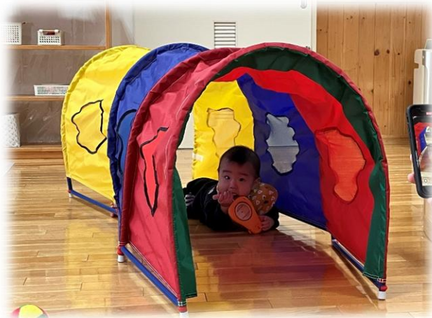
初めてのトンネル♪