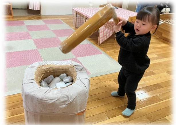
ぺったん♪ぺったん♪