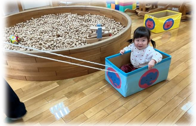
しゅっぱつしんこーう!