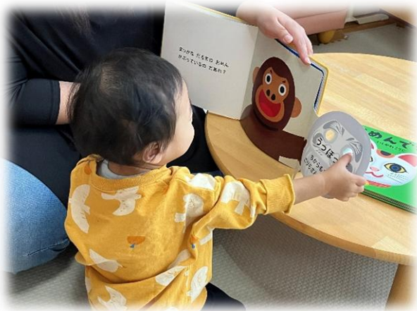
なんのおめんかな??