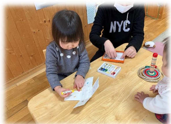
コマ作りしたよっ